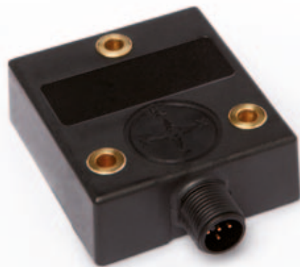
IK360L: 0... 360^\circ / \pm 80^\circ